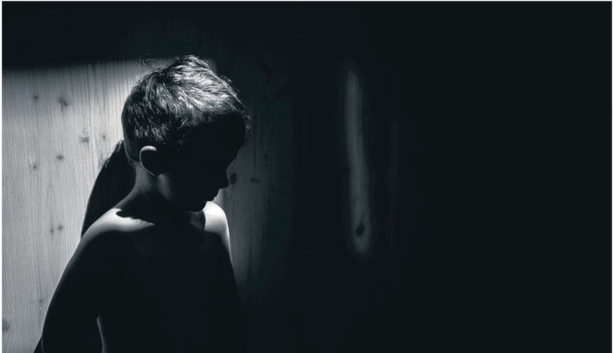
Imatge en blanc i negre d'un menor anònim.