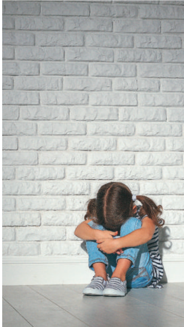
Los casos de abusos a menores han crecido en los últimos años

► El Instituto Catalán de la Salud (ICS) puso en marcha un juego de mesa que entrena a los sanitarios de los servicios de urgencias para poder detectar indicios de posibles casos de violencia machista que a veces pueden pasar por alto. El juego, presentado ayer en el Hospital de Bellvitge de L'Hospitalet de Llobregat, tiene como objetivo principal generar una reflexión entre los profesionales que trabajan en urgencias sobre las señales de alerta de posibles situaciones de violencia hacia la mujer y sobre cómo actuar en caso de sospecha que haya este tipo de violencia.