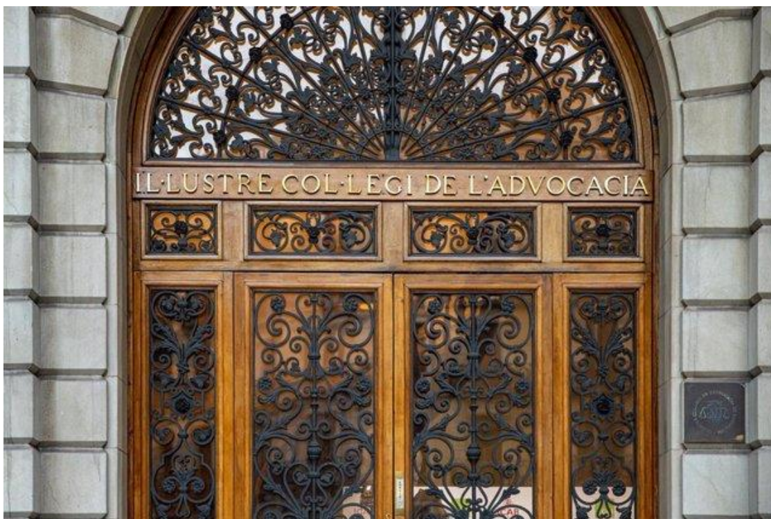
Fachada de la sede de ICAB, a 28 de septiembre de 2023, en Barcelona, Catalunya (España). El Ilustre Colegio de la Abogacía de Barcelona (ICAB) ha organizado la conferencia 'El Crimen de la Guardia Urbana', sobre el caso de Rosa Peral para resaltar la esp- Lorena Sopêna - Europa Press