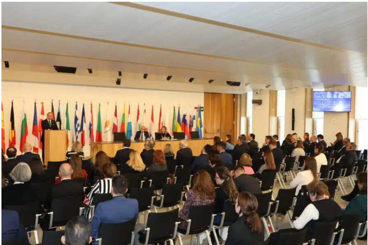
El Decano del ICAM clausura la Primera Cumbre de Derecho de la UE.

Para ello, los europeos debemos “reconstruir nuestra autoconfianza, ser más realistas y menos ideológicos, y renovar nuestro compromiso con los valores”, ha aseverado.