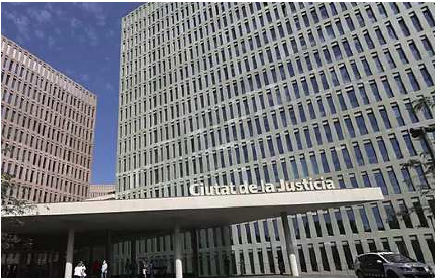
Entrada a la Ciudad de la Justicia de Barcelona

Poco después de entrar en vigor la atención obligatoria de las denunciantes, el Colegio de la Abogacía de Barcelona recibió unas 600 peticiones en mes y medio