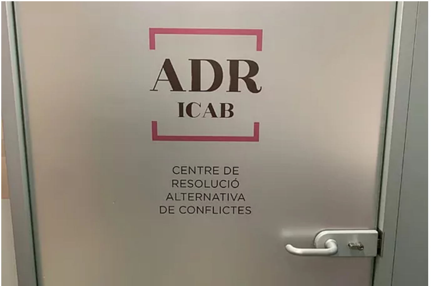
Sede del la mediación de ICAB