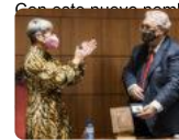
Las "Jornades de Dret català a Tossa" reciben el Premio Puig Salellas 2021