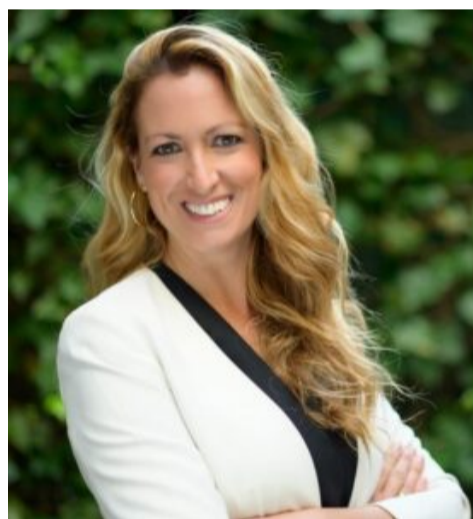
María Eugenia Gay

El próximo 4 y 5 de febrero, y de manera virtual, distintas líderes vinculadas al mundo de la justicia, política, tecnología, negocios y cultura, entre otras áreas, discutirán sobre el impacto de la mujer en la toma de decisiones y de cómo alcanzar la paridad en ellos. “Mientras la igualdad no sea una realidad será necesaria la celebración de eventos como éste”, adelanta quien encabeza la entidad organizadora y que se ha convertido en uno de los rostros más visibles de la abogacía femenina en España y Europa.