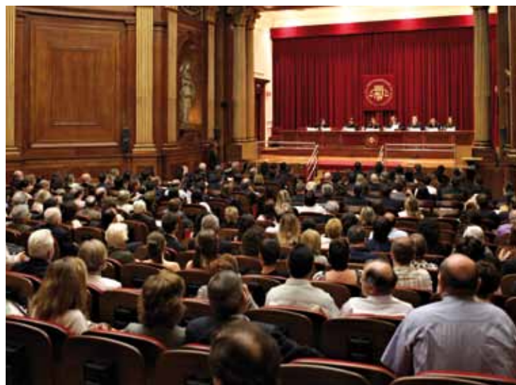
29 de maig: Acte d'imposició de togues