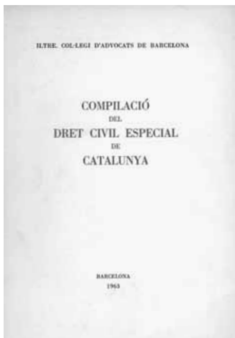
Original de la Compilació del Dret Civil especial de Catalunya, propietat de la Biblioteca del Col·legi.

Ha estat reconegut per tothom que la tasca dels compiladors va ser d'un mèrit extraordinari, ateses les dificultats polítiques de l'època i el seu resultat va ser un text que sense renunciar a les nostres fonts i tradicions, i expressat en llenguatge clar i modern, va facilitar la invocació i aplicació d'aquelles institucions més vives que responien a una veritable i comprovada realitat; per això, com hem dit els primers interessats i beneficiats en l'aprovació de la Compilació varen ser els advocats i els notaris. Sens dubte va ser en els àmbits del dret de família i de successions on va ser més notable el resultat de la tasca compiladora, sense oblidar però el gran mèrit que va tenir en el camp del dret contractual la regulació molt ben perfilada d'una institució tan arrelada com