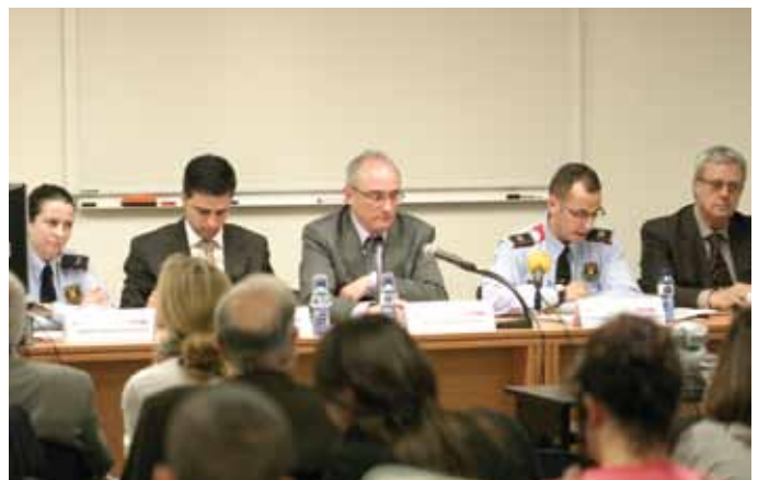
13 de maig. Jornada: 'Navegar per la xarxa: un esport de risc per a la infància i l'adolescència', organitzada per la Secció de Dret de la Infància i l'Adolescència en col·laboració amb la Secció de les Tecnologies de la Informació i la Comunicació i la Policia de la Generalitat-Mossos d'Esquadra.