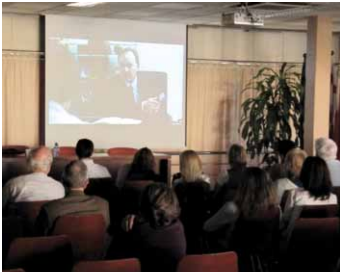
27 d'abril. Cinefòrum organitzat per la Comissió de Dret penitenciari amb la Projectió de dues obres: 'Las dos vidas de Andrés Rabadán' i 'El perdón'.