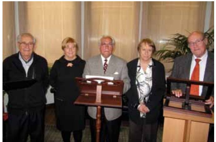
5 de maig. Recital poètic literari a càrrec de la Comissió d'advocats sèniors.