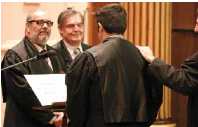
7 de maig. Imposició de togues