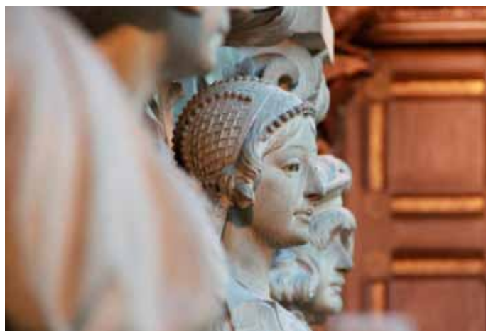
Detall de l'edifici modernista on s'allotja la Subdelegació del Govern.