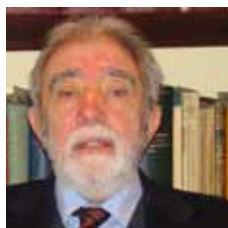
Joan M. Xiol Quingles Col·legiat núm. 7.832

L a sentència dictada pel Tribunal Suprem el 25 de març de 2010 (ponent XIOL RIOS) obre una petita via per a poder reclamar el lucre cessant derivat d'una lesió permanent mitjançant l'aplicació del sistema de valoració del dany corporal annex a la Llei sobre Responsabilitat Civil i Assegurança en la Circulació de Vehicles a Motor, que s'aplica amb caràcter vinculant per valorar els danys i perjudicis soferts com a conseqüència d'un accident de trànsit, però que, pel seu efecte expansiu ve sent aplicat per a la valoració dels danys i perjudicis derivats de fets aliens al trànsit viari.