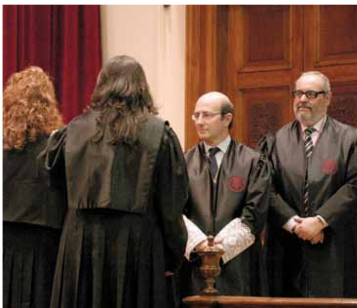
5 de març. Imposició de togues.