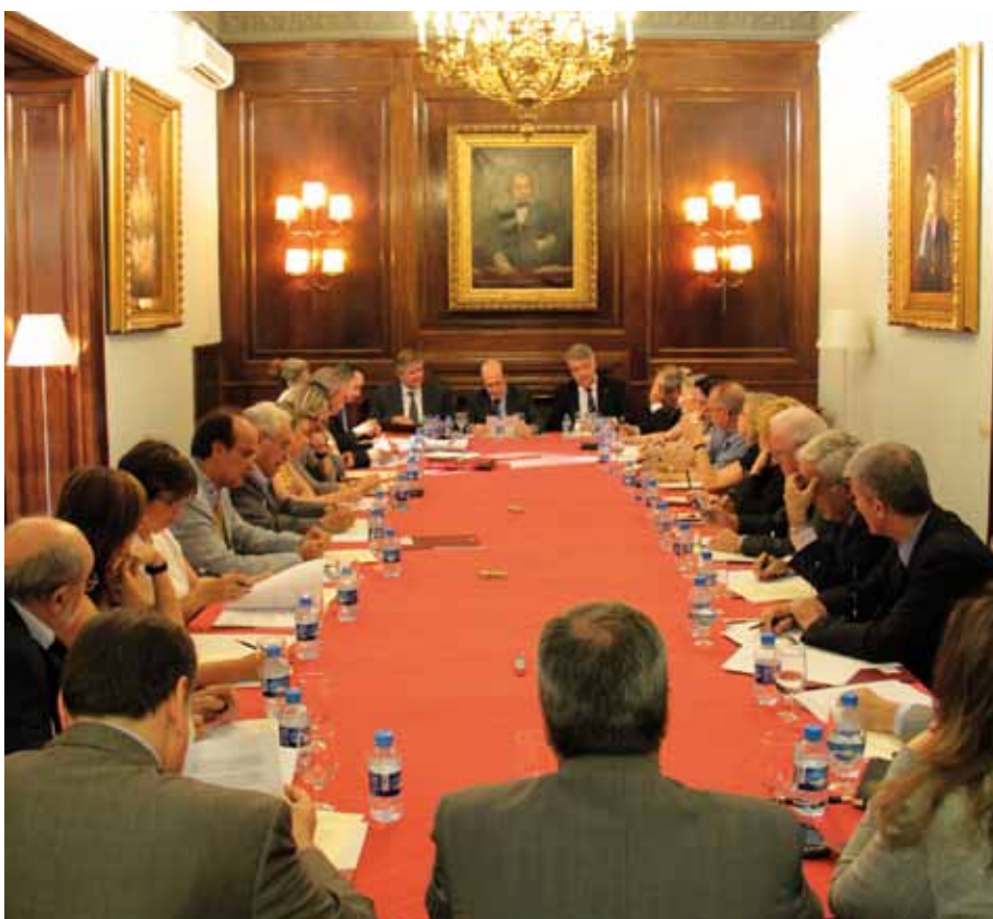
Primera reunió de treball de l'Associació a l'ICAB (25 de maig)

Amb l'objectiu d'aconseguir la màxima representativitat en els seus òrgans de govern, l'Associació compta amb una Junta Directiva formada per president, sis vice-