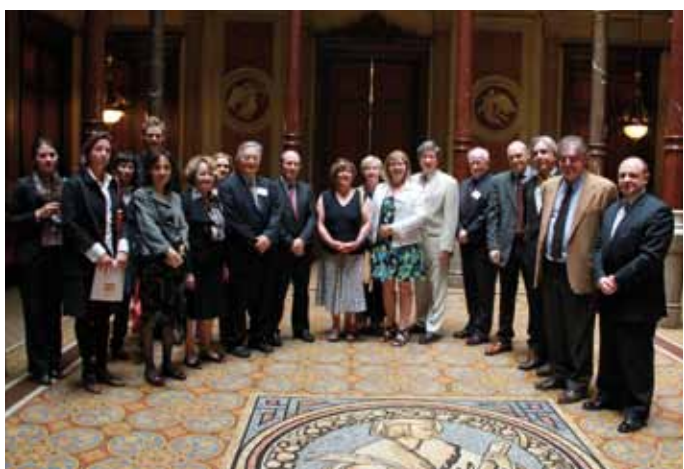
12 d'abril: Visita de la delegació de juristes del Quebec amb motiu de la celebració a Espanya de la XXIè. Conférence Internationale et Multidisciplinaire de Gens de Justice.