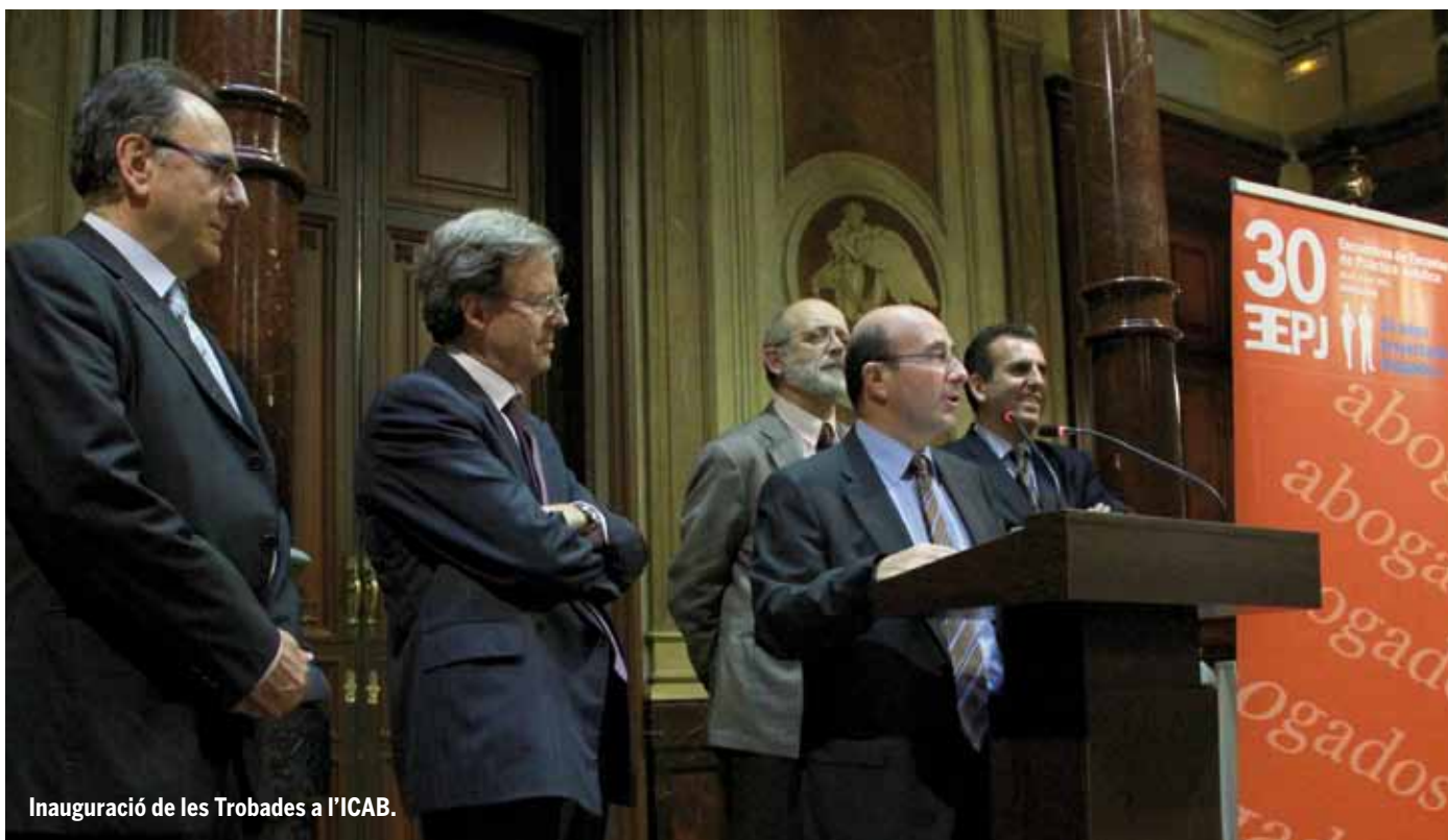
Inauguració de les Trobades a l'ICAB.

AQUESTA ÉS LA TERCERA VEGADA QUE EL COL·LEGI D'ADVOCATS DE BARCELONA ACULL LES TROBADES D'ESCOLES DE PRÀCTICA JURÍDICA. DE FET L'ESCOLA DE PRÀCTICA JURÍDICA DE L'ICAB, AMB 42 ANYS DE TRAJECTÒRIA, ÉS UNA DE LES MÉS ANTIGUES D'ESPANYA.